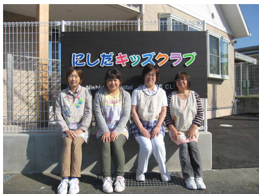
にしだキッズクラブの看護師と保育士です

す。スタッフは病児のケアに関するトレーニングを受けた専任の看護師と保育士で、容態が悪くなった場合は、小児科医が対応できる体制があります。